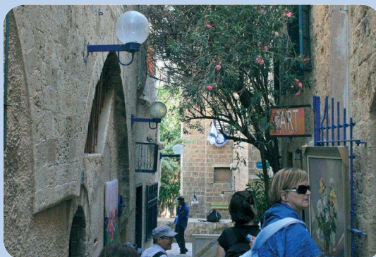
PROMENADES DANS LES RUES DE JAFFA

Ce voyage fut pour nous un temps inoubliable qui marque encore notre foi et notre lecture de la Bible. Nous avons particulièrement apprécié la qualité de l'organisation et l'équilibre