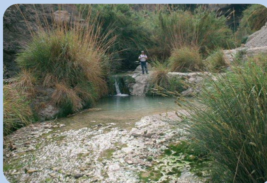
UNE DES SOURCES D'EN-GUÉDI