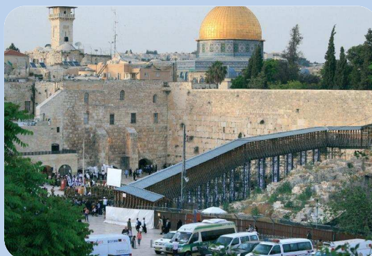
LE MUR DES LAMENTATIONS